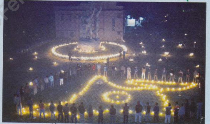
কাদের মোল্লার ফাঁসির দন্ড কার্যকর হওয়ায় কুয়েটে ক্যান্সাসের মুক্তিযুদ্ধের ভাস্কর্য “দুর্বার বাংলা”র পাদদেশে মোমবাতি প্রজ্জ্বলন ও জাতীয় সঙ্গীত পরিবেশিত হয়।

একাত্তরের মানবতাবিরোধী অপরাধের দায়ে জামায়াতের সহকারী সেক্রেটারি জেনারেল আবদুল কাদের মোল্লার ফাঁসির দন্ড কার্যকর হওয়ায় সন্তোষ প্রকাশ করেছে খুলনা প্রকৌশল ও প্রযুক্তি বিশ্ববিদ্যালয় (কুয়েট) শিক্ষার্থীরা। এছাড়া কাদের মোল্লার ফাঁসির দন্ড কার্যকর হওয়ায় ক্যান্সাসে শিক্ষার্থীদের অংশগ্রহণে আনন্দ মিছিল অনুষ্ঠিত হয়। মিছিল শেষে কুয়েট ক্যান্সাসের মুক্তিযুদ্ধের ভাস্কর্য “দুর্বার বাংলা”র পাদদেশে মোমবাতি প্রজ্জ্বলন ও জাতীয় সঙ্গীত পরিবেশন করা হয়।